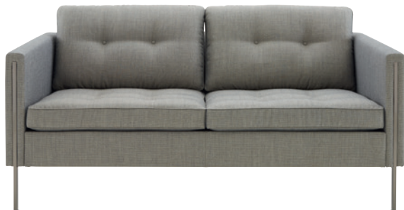
DESIGN PIERRE PAULIN