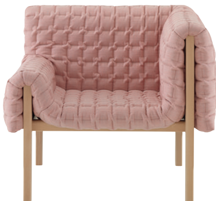
DESIGN INGA SEMPÉ

Эта элегантная модель сочетает в себе архитектурную форму и мягкое содержание. Спинка и подлокотники соединены друг с другом таким образом, что образующееся внутреннее пространство дарит максимальный комфорт. Ножки – массив бука, натурального оттенка или антрацит. Наряду с 2-местным диваном (ширина 150 см, глубина 82 см, высота 86 см, высота сиденья 41 см) серия MCD включает 3-местный диван, кресло и пуф.